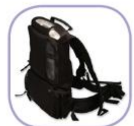
MOCHILA TRANSPORTE ***