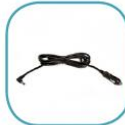
CARGADOR AUTO *