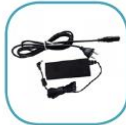
CARGADOR CA *