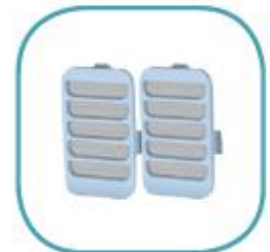
FILTRO EXTERNO *