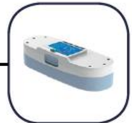
BATERÍA DOBLE **