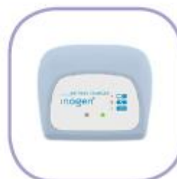
CARGADOR EXTERNO ***