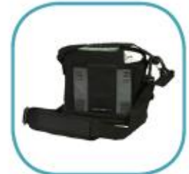
BOLSO TRANSPORTE *