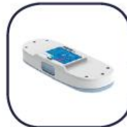
BATERÍA SIMPLE **

*Precio varia según la elección de batería. Opción 1, 2 o 3. Consultar disponibilidad*